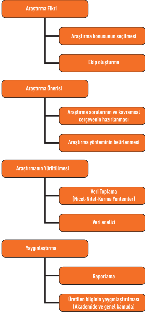
Şekil 2. Araştırmanın Aşamaları